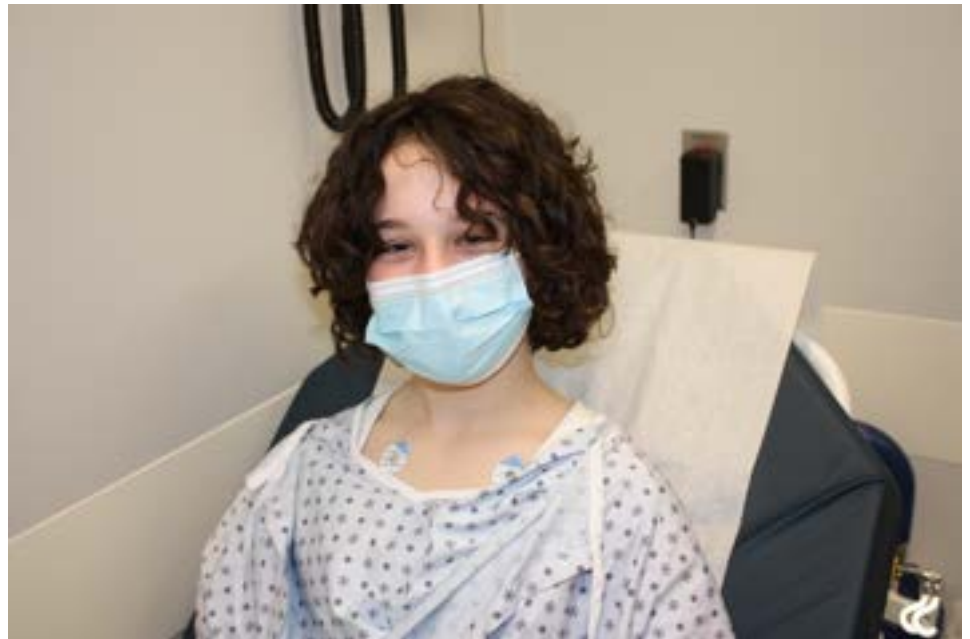
Électrodes de moniteur cardiaque

L'équipe pourrait également placer trois autocollants ronds appelés électrodes de moniteur cardiaque sur ta poitrine. Ces autocollants écoutent les battements de ton cœur pendant la procédure et suivent ta respiration.