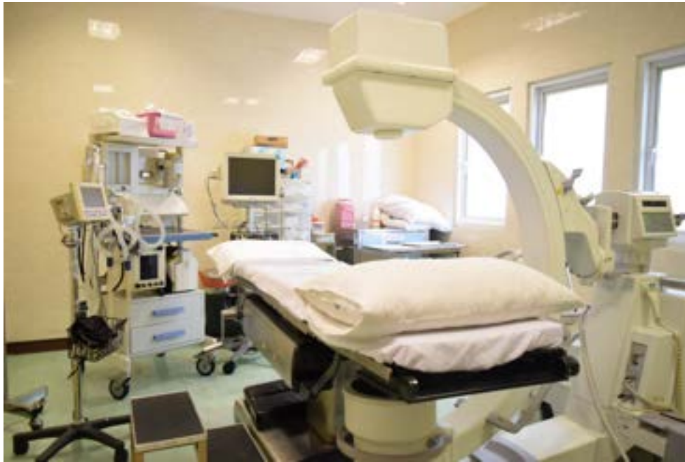
Arceau ("C-arm") de rayons-X

En fonction de l'endroit où l'on veut placer le médicament pour le bloc, nous pouvons utiliser les équipements suivants pour mieux cibler la zone : un arceau ("C-arm") pour des rayons-X ou une échographie .